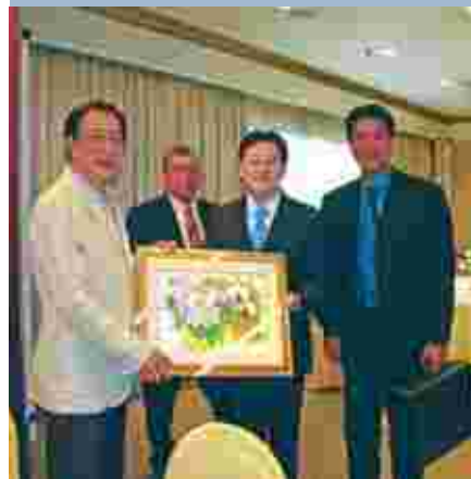
วารสารความร่วมมือกับต่างประเทศ ปีที่ 7 ฉบับที่ 1